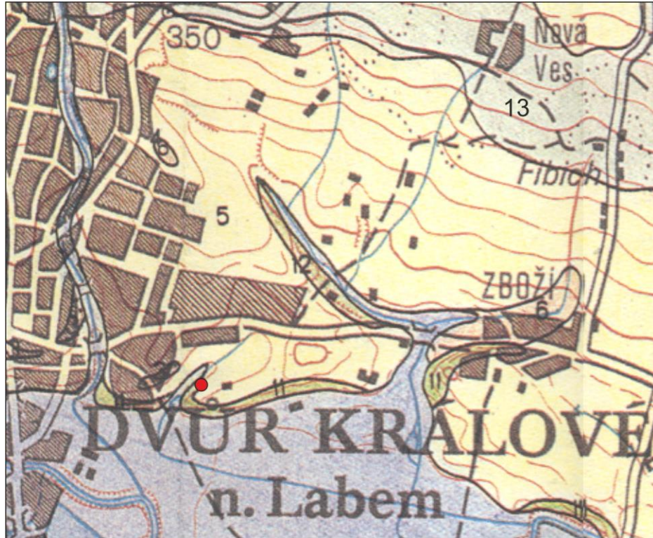
Výřez z geologické mapy ČR. List 03-44 Dvůr Králové nad Labem. 1. vyd. ČBÚ Praha, 1998.